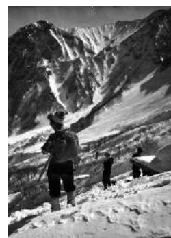
昭和 37 年冬季 6 合目