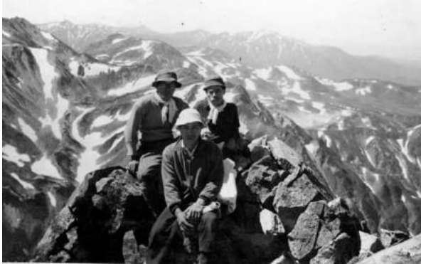
劔岳頂上より室堂

昭和 31 年か 32 年と推定する。ルートは室堂～劔岳～阿曾原～十字峡～阿曾原だったらしい。父の記憶では室堂に入るのに砂防工事の軌道に便乗して松尾峠を越えて入ったそうだ。美女平へのケーブルの開通が昭和 29 年で、さらに翌年には、バスが弘法まで開通しているのでそれより以前かとも思ったが、黒四ダムの工事が始まっていたそうだから昭和 31 年以降だ。さらに阿曾原から樺平まで高熱隧道を通る軌道に乗ったそうだ。軌道は工事が本格化してから便乗が出来なくなったから、31 年か 32 年だろう。黒部川の水平歩道を、おっかなびっくり進んでいると、セメント袋（当時は 50 キロ）を両肩に担いだ人夫にじゃまだと、どやされたそうだ。