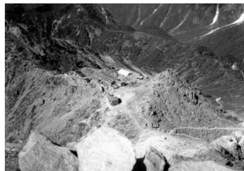
槍ヶ岳頂上より前穂北尾根望む 足元はゲートルに地下足袋