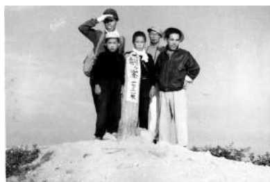
大山 3 剣ヶ峰、大山 4