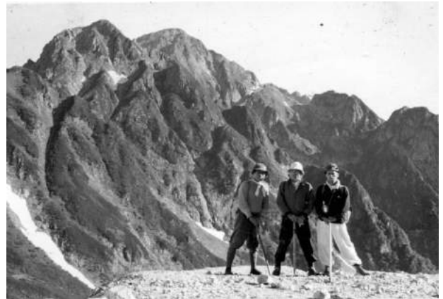
劔沢小屋付近から劔岳